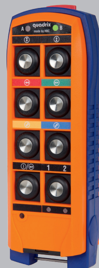
Version mit Rückmeldung über LED.